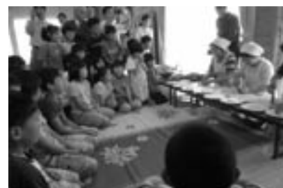
fig.8 お母さんたちが野菜の切り方を披露

この写真は、そうやってでき上がった精進料理を、作ったお母さんたちと、いわば孫たちが向い合って食べている場面です [fig.9]。食育とはこのような