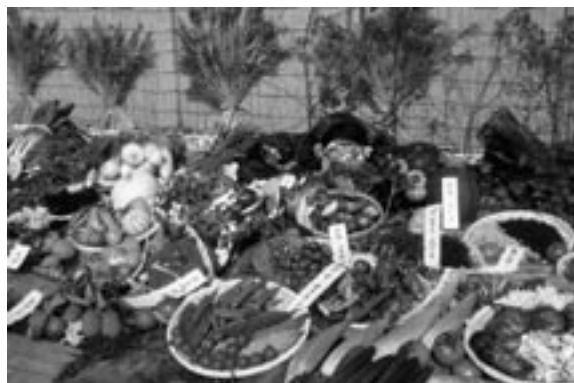
fig.11 お母さんたちが持ち寄った食材 (一部)