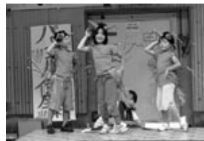
fig.6 伊勢エビについての劇