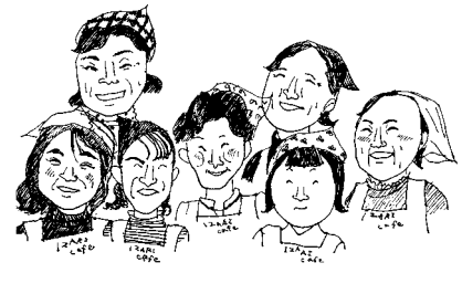
fig.16 漁村カフェのおばちゃんたち

女性がこのカフェで働いています。漁師のおっちゃんおばちゃんたちの下で、いま伊座利人見習い中です。この絵は彼女が描いたカフェで働くおばちゃんたちの似顔絵です [fig.16]。