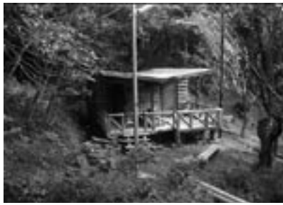
fig.14 キャンプ場の秘密基地

地区の新たな魅力づくりにも取り組んでいます。休業状態であった町営のキャンプ場を「倶楽部イザリ〜ノキャンプ場」として再生復活させました。3年間使われていなかったキャン