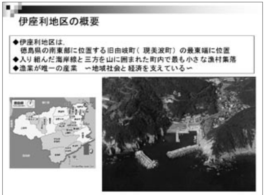
fig.1 伊座利地区の概要

どう進めていくのか。こういった大きな課題が生まれてきました。そこで、子どもからお年寄りまで全住民で構成し、地区内にある漁業協同組合や学校、町内会、婦人会など、すべての組織、団体を融合する「伊座利の未来を考える推進協議会」を平成 12 年 4 月に結成いたしました。そして「交流」をキーワードに本格的に漁村留学などの地域活性化活動を開始しました。