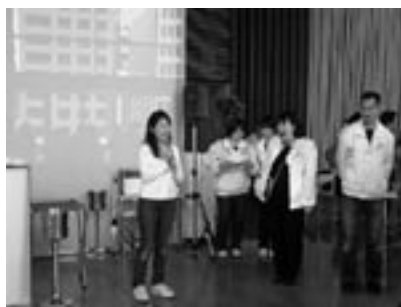
fig.10 元漁村留学生による伊座利紹介