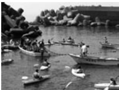
fig.2 カヌー（カヤック）体験

さて、この「おいでよ 海の学校へ」の活動を通してさまざまな課題が生まれました。受け入れとなる住宅をどうするのか。また、漁業以外に産業はありませんから、漁業以外の就業機会をどうするのか。単なる瞬間的な活動ではなくて、やはり計画的、継続的な活動でなければいけない。地域づくりを