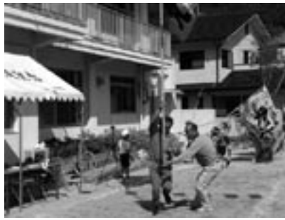
fig.9 運動会でのリレー

さて、伊座利は漁業によって成り立っていますが、それは自然の恵みによって成り立っているということでもあります。そうしたことから、自然環境をみんなで守らないといけないということで、2カ月に一度ぐらいですが、地域のクリーンアップ活動を行っています。この活動には赤ちゃんからお年寄りまでほぼ全員が参加しています。海岸に打ち寄せられたゴミや道に捨てられている空き缶をきれいにします。