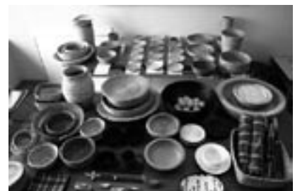
fig.18 ワークショップから「うつわの会」へ