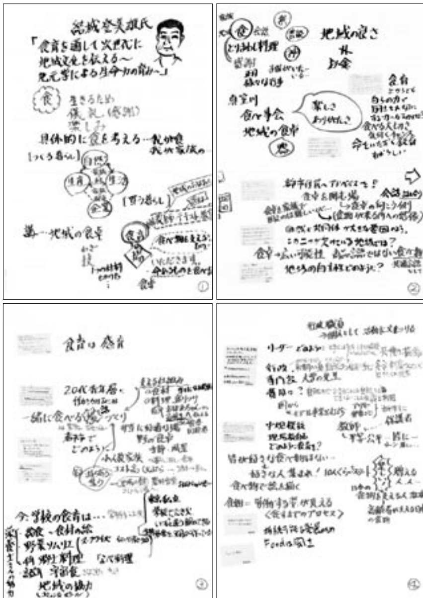
結城氏の講演まとめ [制作：町田万里子+堤祐子]

極端に言えば、会話なんてなくてもいいのです。たとえばいつもお弁当箱を空っぽにして帰ってくる子どもが、今日は半分残して帰ってきたら、学校で何かあったのかなと感じ取れます。いつもご飯をお代わりするお父さんが、今日は一膳しか食べなかったら、