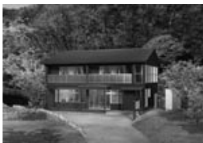
fig.15 漁師のおばちゃんの漁村カフェ