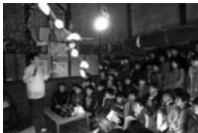
fig.12 古民家で正月行事を学ぶ

これは薬師堂です。ここの天井には薬草が描かれています [fig.13]。これは、「胃が痛むのだったらこの方角にあるこれを探って煎じてこう飲みなさい」という処方箋だったのです。古くなつたからと白で塗りたくられたり、別のデザインに変わっていることもありますが、それでは薬師堂という意味が伝わりません。薬師堂とは薬草の文化みたいなものなのです。こういった教室は、集落単位でやるのが精いっぱいだなと思っています。