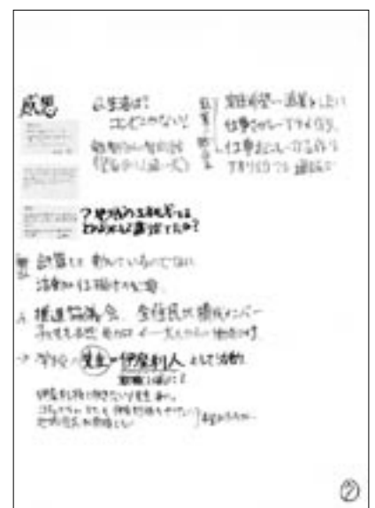
講演の感想 [制作：町田万里子+堤祐子]

そのときは郷土料理でないといけなとか、そういうことはどうでもいいのです。レンジでチンしてもいいのです。冷蔵庫に余っている1品でも輪ができればいいのだと私は思います。そこに子どもも交えて、おにぎりでも握らせるとか。私はそのときに、絵を描けと言いました。食べ物で絵を描く。