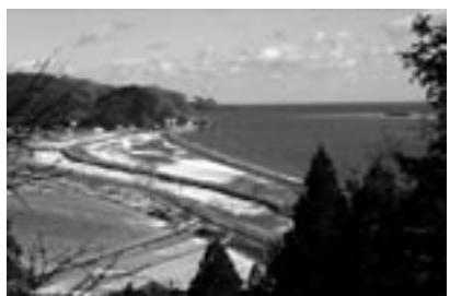
fig.1 海と川が出会う町、宮城県北上町

これは宮城県北上町という人口3,900人の町です [fig.1]。いまは石巻市に合併されましたが、岩手から流れ出た北上川が河口で太平洋に出会う場所にあります。知事の浅野史郎さんに「食育というのをやりたいんだが、どこがいいか」と聞かれたときに「この町がいいな」と言ったら、「あそこは何もないだろう」と言われた場所です(笑)。どうも社会科ばかり勉強した人たちは、大きな町の方がいいというイメー