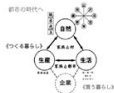
fig.5 暮らしの変化のダイアグラム

そこで、この町のおばあちゃん、お母さんたちに、「売ってはいないが自分の家で育てているもの」を聞いてみました。すると13人中13人が、ナスやトマトなど何かしら作っていると答えました。全部で野菜が86種類もありました。キノコ、山菜、木の実、魚、海草などの採取しているものも含めると、350種類もの食糧が自給されていました。そのうち市場などに卸しているものは、シジミの一部とワカメだけでした。