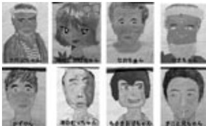
fig.4 おっちゃん、おばちゃんの似顔絵

いという思いから伊座利へやって来ました。子どもたちは伊座利へやって来たその翌日から、全員が学校へ行くようになりました。彼らは伊座利で3年ほど過ごしました。