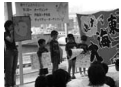
fig.12 徳島市内での交流活動の様子