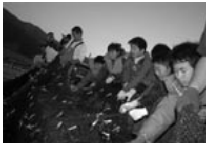
fig.5 大敷網 (定置網) 漁業体験

さて、伊座利にはブリを取る定置網の漁法があります。大敷網と呼んでいます。全盛期には一晩で2千万、3千万円もの漁獲量を誇っていました。しかしいまでは海の環境が変わってしまい、ブリは減っています。ですからこういった小さな魚も取っています。