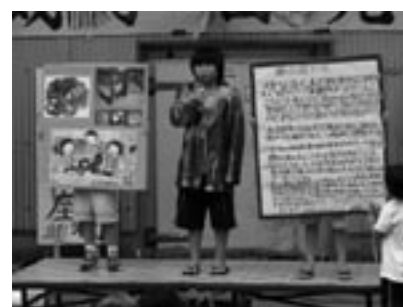
fig.7 遊山箱についての発表

伊座利では大人も子どもも一緒になって、祭りや運動会を行っています。毎年10月14日から16日まで開かれ