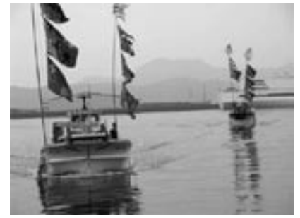
fig.11 徳島市まで漁船で向う

で、伊座利での思い出を語ってくれました。彼女は「伊座利には変なおっちゃん、おばちゃん、助平なおっちゃん、おばちゃんがいっぱいいます。だけど、そんなおっちゃん、おばちゃん大好きです」と語りました [fig.10]。