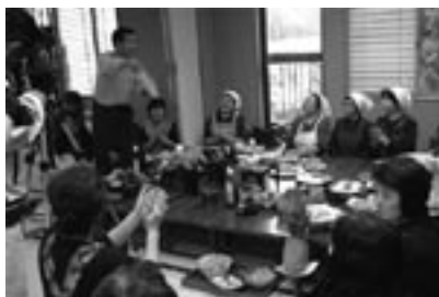
fig.16 食文化を見つめ直す「食べ事会」