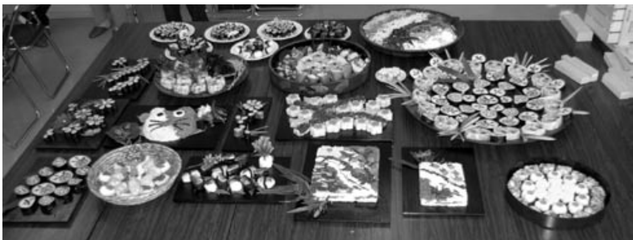
fig.21 真室川の風景を折り込んだ鮎