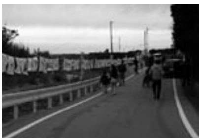
fig.13 バンダナ・アート展