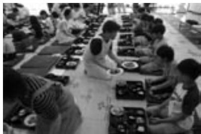
fig.9 お膳で味わう精進料理