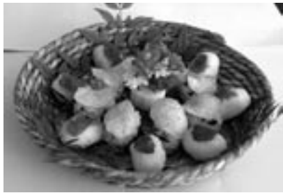
fig.20 ポテトチップスの鮎

と言ってパン作りも始まります [fig.19]。するとそれまではジャガイモといえばサラダぐらだったのがペーストに変わったり、お焼きパンなんかも作られます。それぞれの食材は参加者一人ひとりが作ってくれています。これが1つのパンを作るための材料です。そのための畑があって、そこをグルグル回ると食育のツアーができるようになっていきます。こういうふうになると、定食屋でもやろうかとか、レストランでもやろうかとか、おばあさんたちが張り切り出してくるわけです。